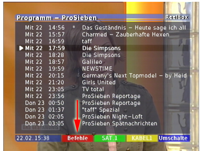
Bild 01: Gewünschte Sendung im EPG wählen und „0“ drücken - Schaltfläche „Befehle“ wird eingeblendet

Nach der Erstellung eines automatischen Such-Timers dauert es maximal 30 Minuten, bis die ersten Ergebnisse in der Timer-Übersicht angezeigt werden. Bei jedem EPG-Scan